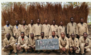
Agradecimento dos fiscais de Dombawera (área sob gestão privada) ao apoio prestado pela BIOFUND.