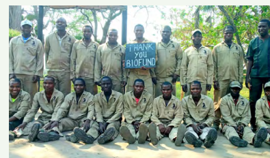
Agradecimento dos fiscais de Mahimba (área sob gestão privada) ao apoio prestado pela BIOFUND.